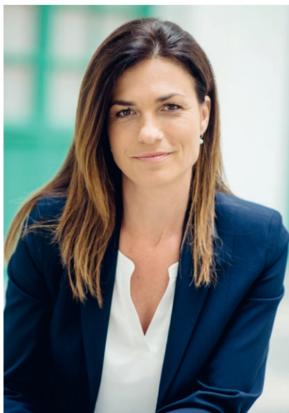
Varga Judit Igazságügyi Miniszter Minister of Justice of Hungary

„A hegedű a maga nyelvén dalol, és hamis lesz tőle minden beszéd.”